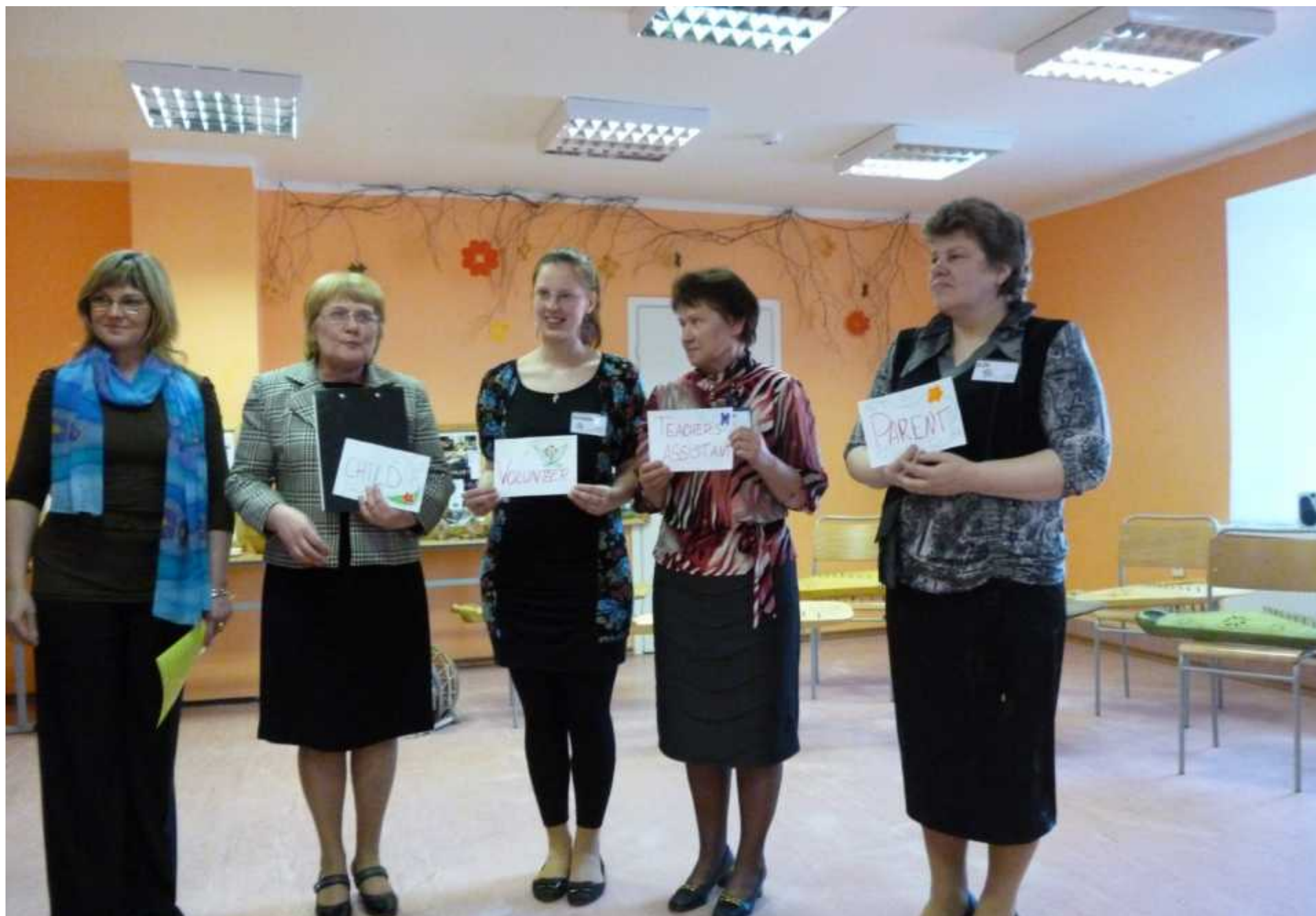
Tirza osnovna škola, Riga