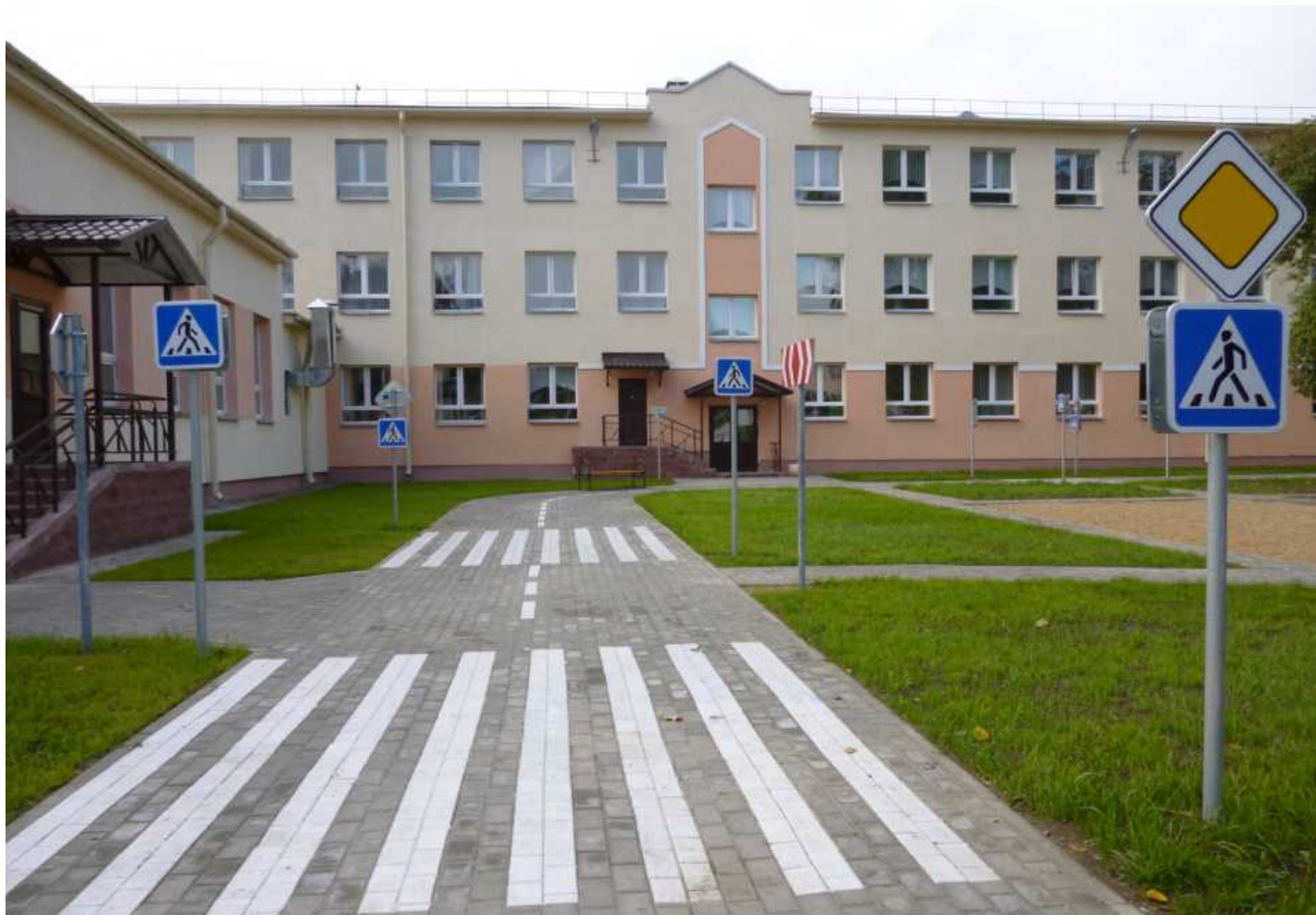
Škola br. 91, Minsk