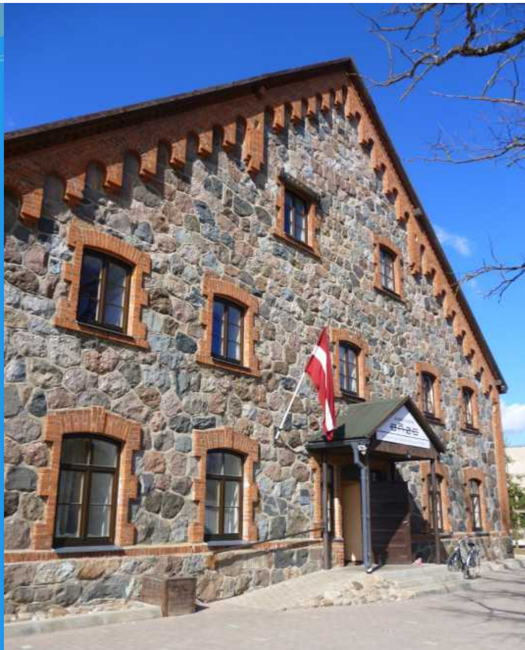
Gluberne srednja škola br. 2, Riga