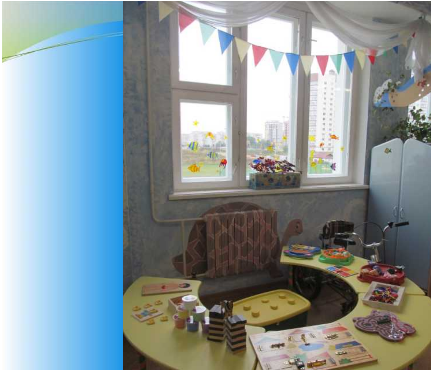
Škola br. 25, Minsk