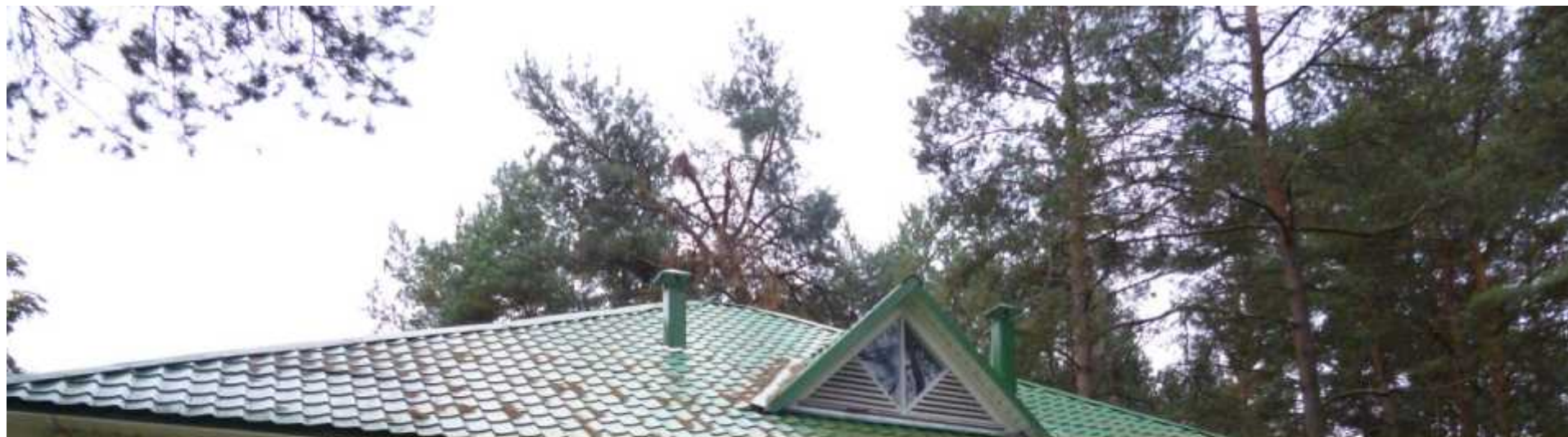
National Children's educational and health center Zubryonok Minsk